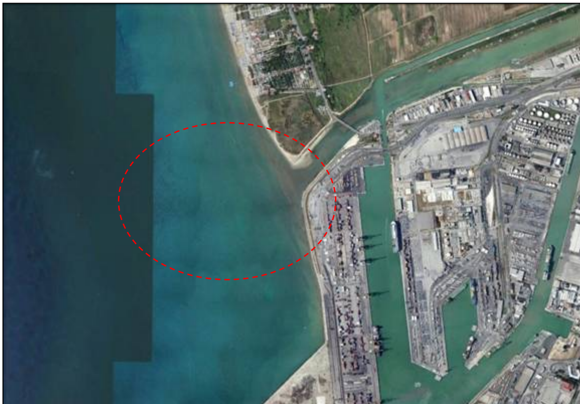
Area oggetto dell'indagine

100 S e 100 W. La mancanza di tossicità cronica (test di embriotossicità) in tutte le stazioni ha documentato un evidente miglioramento delle condizioni ecotossicologiche della colonna d'acqua per lo sviluppo regolare degli embrioni di P. lividus . Il test Microtox® con il V.fisheri e il saggio biologico con D. tertiolecta non hanno rilevato alcuna tossicità dei campioni di acqua nelle campagne realizzate.