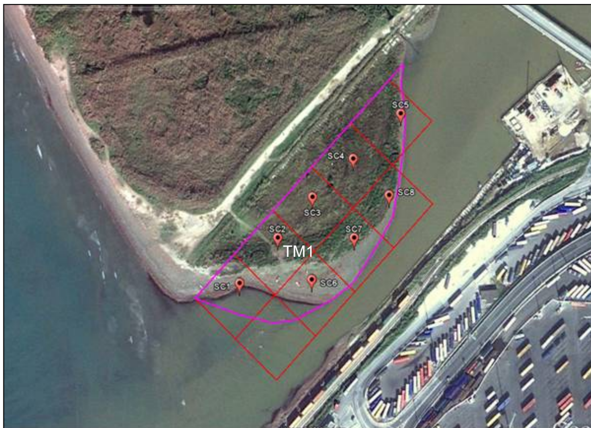
Area oggetto dell’indagine e posizione delle stazioni di campionamento

Il presente studio riguarda la descrizione delle caratteristiche fisiche, chimiche, microbiologiche ed ecotossicologiche dei sedimenti ubicati presso la foce del Canale Scolmatore che devono essere dragati per favorire il deflusso delle acque del suddetto Canale. Le attività svolte e di seguito descritte sono state effettuate prendendo come riferimento le indicazioni riportate nel “Manuale per la movimentazione di sedimenti marini” (ICRAM-APAT-MATTM, 2007) e in base a quanto riportato nel Regolamento della Provincia di Livorno per la gestione dei procedimenti di cui alla Legge Regionale Toscana del 4 aprile 2003, n.19, Movimentazione sedimenti marini, Marzo 2009. La zona oggetto dell’indagine si trova in prossimità della foce del Canale Scolmatore lungo la sponda destra, ed è costituita da un affioramento di sedimento che ostruisce gran parte della foce del canale. Sul perimetro dell’area indagata è stata posta una maglia quadrata di 50 metri di lato che ha permesso di individuare 8 aree unitarie corrispondenti a 8 stazioni di campionamento. Per ogni stazione è stato effettuato un carotaggio manuale, spingendo a percussione un liner di policarbonato nel sedimento fino alla profondità di un metro. Per ogni carotaggio sono stati individuati e prelevati i livelli 0-50 cm e 50-100 cm.