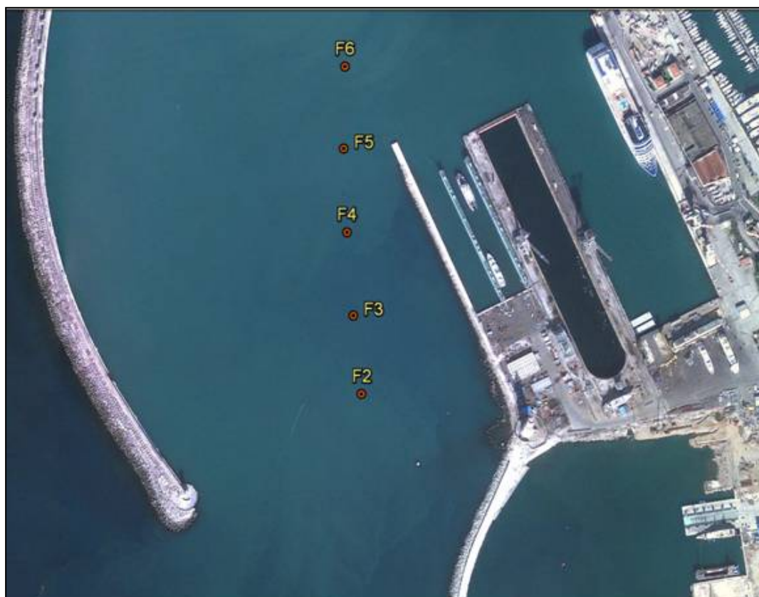
Area di indagine e stazioni di campionamento

In ciascuna di queste stazioni è stata effettuata una bennata mediante benna Van Veen da 2,5 l calata a mano da un operatore in modo da recupero un quantitativo di sedimento superficiale sufficiente per le analisi.