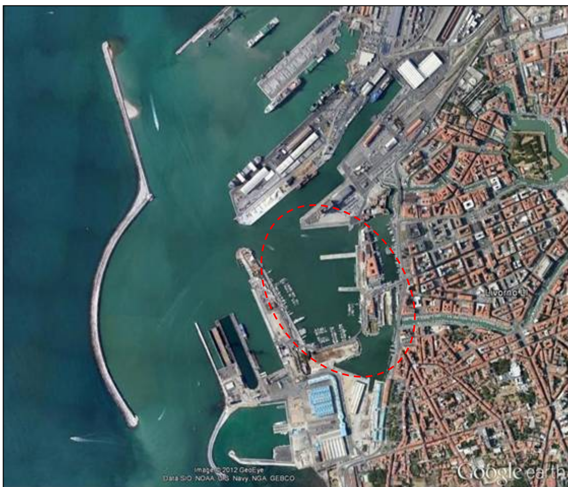
Area di indagine e stazioni di campionamento

Il presente studio è rivolto alla caratterizzazione fisica, chimica, microbiologica ed ecotossicologica dei sedimenti del Porto Mediceo e della Darsena Nuova del Porto di Livorno nonché all'analisi qualitativa delle acque della stessa area marina portuale. Le indagini sui sedimenti sono state effettuate sulla base delle indicazioni previste nell'allegato B/1 del D.M. 24 gennaio 1996 del Ministero dell'Ambiente opportunamente modificate alla luce di quanto riportato nel documento ICRAM-APAT-MATTM "Manuale per la movimentazione di sedimenti marini" (Agosto, 2006) e nel documento "Disposizioni Procedimentali" della Provincia di Livorno (Settembre, 2005).